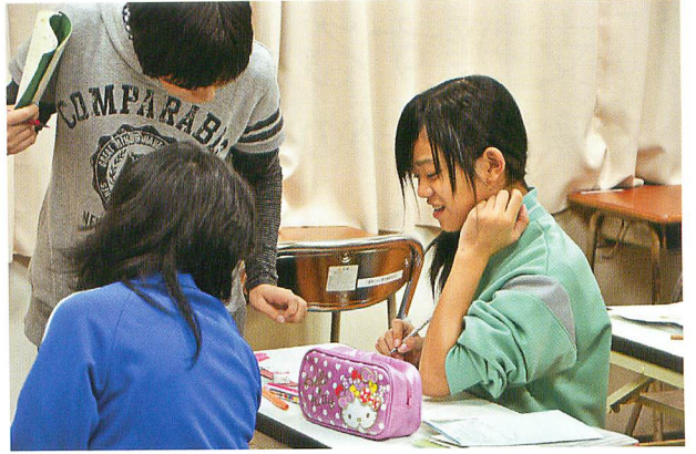
教え合いながら勉強する子どもたち。

NPOこども福祉研究所 ※ が運営する「山田町ゾンタハウス」(岩手県下閉伊郡山田町)。ゾンタハウスは、学校帰りの中学生が立ち寄って軽食を食べ、学習を行なうスペースで2011年9月に開所しました。ゾンタハウスの取り組みについてご紹介します。