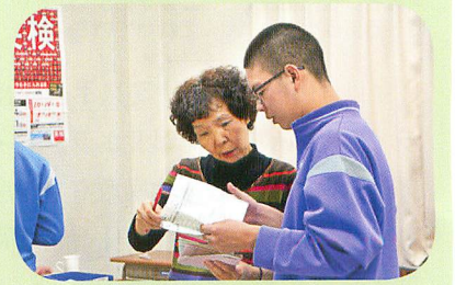
いわて生協より、サンドイッチにはさむ食材やトーストに塗るマーガリン、ジャム、飲み物全般を購入している。